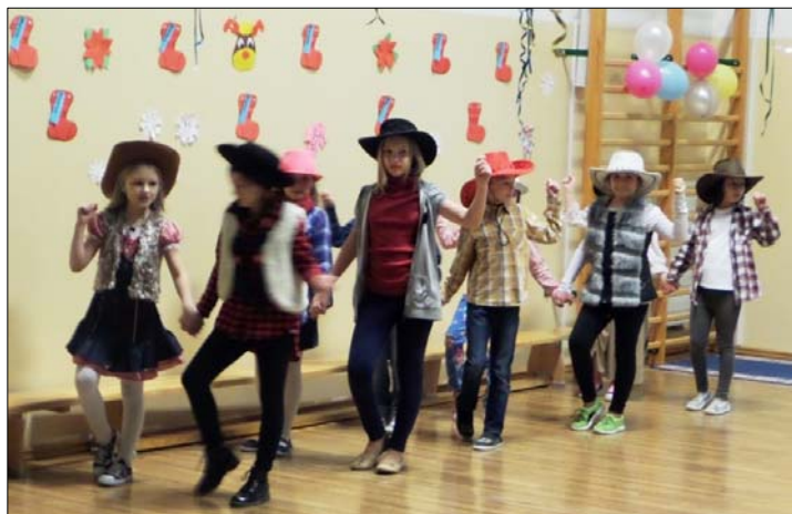
Wigilia szkolna w Drażdżewie – patrz s. 6