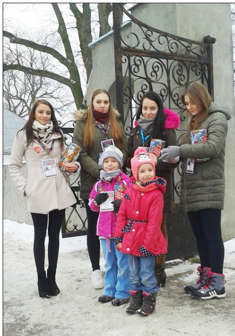
25. Finał WOŚP w Krasnosielcu - patrz s. 3