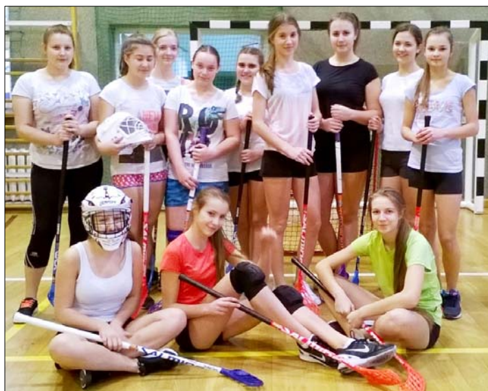
Program „Klub” – patrz s. 9