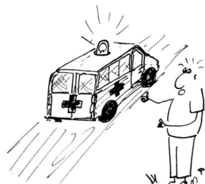
Oto jedyna ostra jazda po dopalaczch!

Zagrożenie związane z używaniem substancji