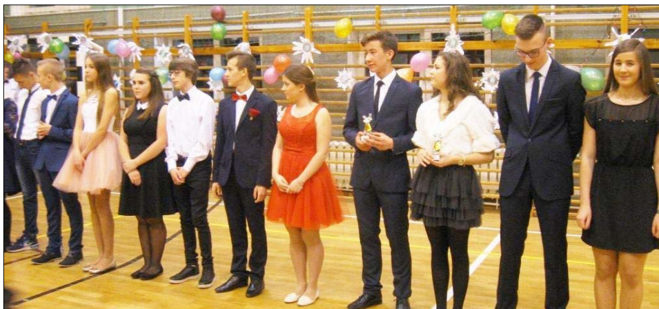
... Młodzież Seniorom – patrz s. 1 i 3.