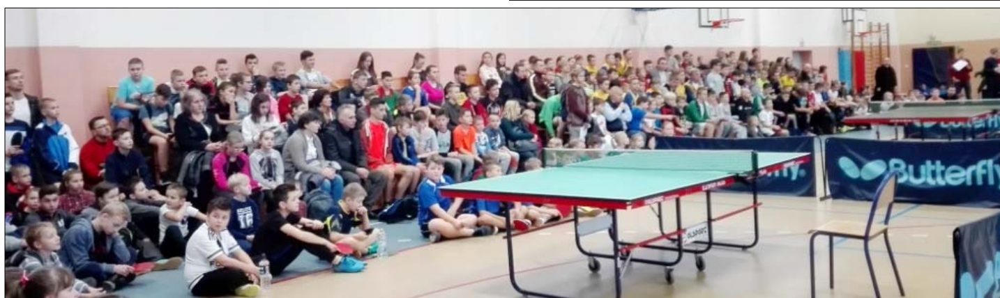
Turniej tenisa w Radości. – patrz s. 8