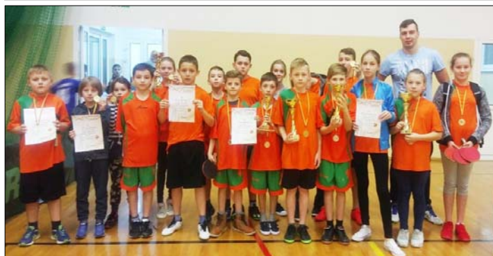
Sportowe sukcesy uczniów z Amelina w 2016 r. – patrz s. 9