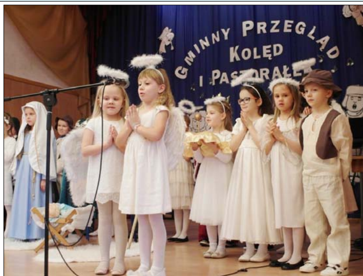
Gminny Przegląd Kolęd i Pastorałek – patrz str. 14.