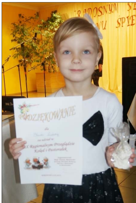
Przeгляд Kólęd i Pastorałek ... – patrz s. 3