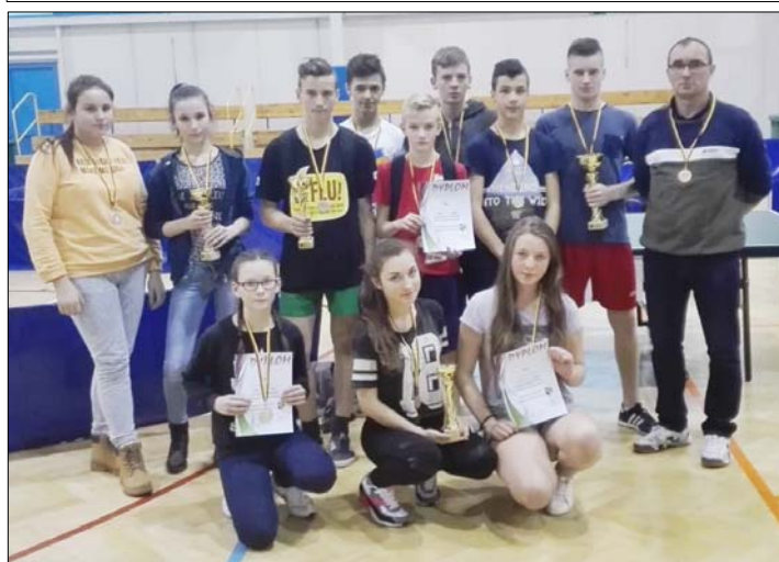
Tenisści z Gimnazjum – patrz s. 9