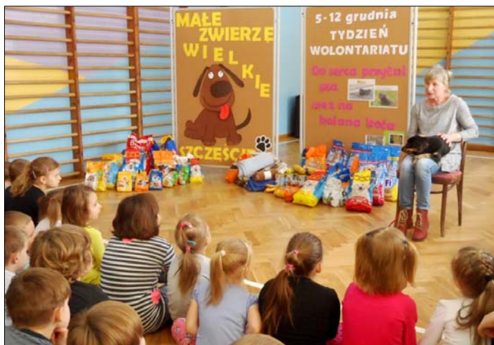
Wolontariat w szkole w Rakach – patrz s. 4