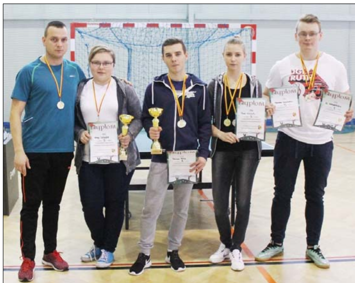
Teniści od Kościuszki – patrz s. 9