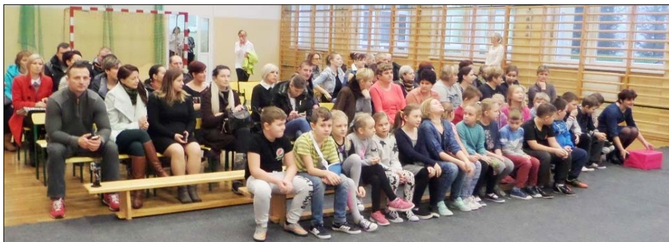
Jasełka w Drażdżewie ... – patrz s. 5