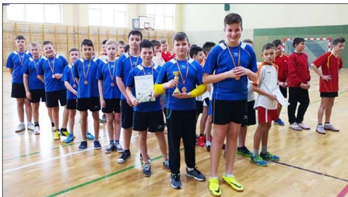
Piłkarze ręczni z sukcesem. – patrz s. 9